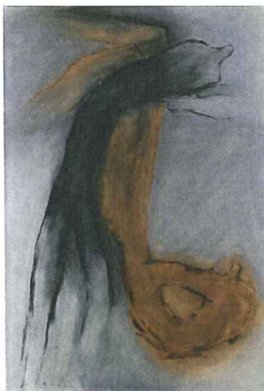
JITKA VÁLOVÁ: VÝSKOK A PÁD / 1995 olej, plátno / 200 × 145 cm

Od 9. března do 9. dubna bude pražský Topičův salon hostit výstavu Jitky Válové mapující více než půl století její tvorby. „Přestože se výstava primárně věnuje tvorbě Jitky Válové, stále tu musíme mít na paměti její sesterský stín, jehož pro-