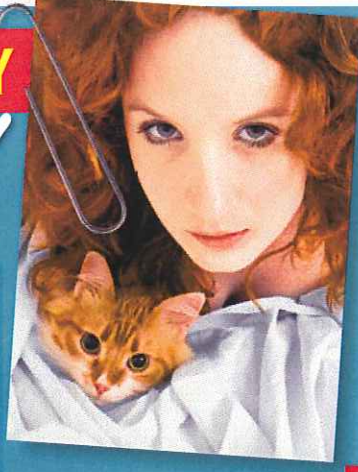
Styling: Kateřina Schnerova; Uniecent: Lúča

Přihlašovací formulář a další podrobnosti najdete na www.prekvapeni.cz .