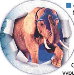
FOTO SOUTĚŽ PRO KOČKY

do 14. 11. Máte rádi artistry, akrobaty, klauny, umělce všeho druhu včetně těch zvířecích? Pak si nenechte ujít ojedinělou cirkusovou přehlídku Cirkus Cirkus Classic, která nedávno vypukla v Praze. Ve speciálním vyhlášeném luxusním stanu na pláni Rohanského nábřeží vystoupí umělci a artisté z Brazílie, Dánska, Itálie, Rumunska, Polska, Ukrajiny a České republiky v neuvěřitelných šedesáti představeních. Více na www.cirkuscirkus.cz .